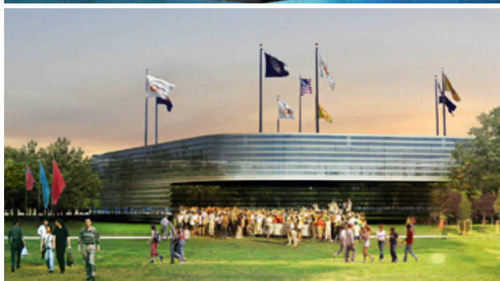
Rappresentazioni indicative dei progetti per l'Expo 2015

VOUI CONTRIBUIRE AL PROSSIMO NUMERO DEL FOGLIO DI BUCCINASCO? Manda una mail a ilfoglio@buccinasco.net